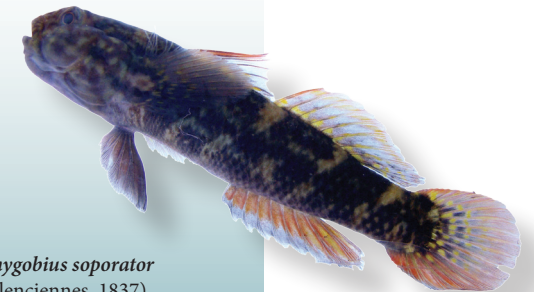
Bathygobius soporator (Valenciennes, 1837) Mapo aguado