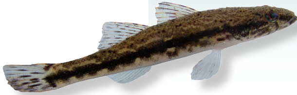
Gobiomorus maculatus (Günther, 1859) Dormilón manchado