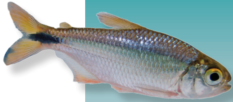
Astyanax finitimus (Bocourt, 1868) Sardinita de Veracruz