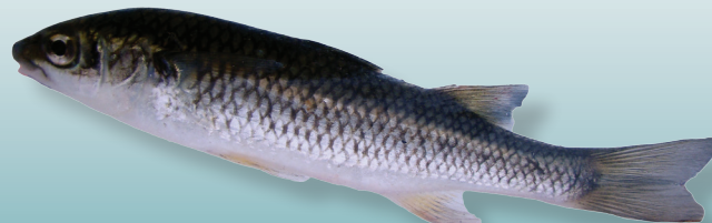
Dajaus monticula (Bancroft, 1834) Trucha de tierra caliente