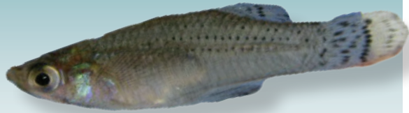
Priapella olmecae Meyer & Espinosa-Pérez, 1990 Guayacón olmeca