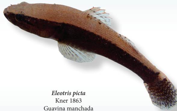
Eleotris picta Kner 1863 Guavina manchada