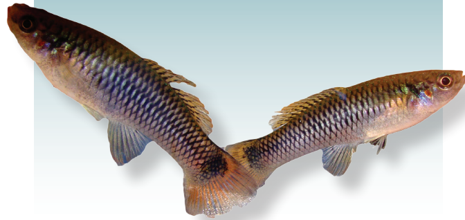
Pseudoxiphophorus bimaculatus (Heckel, 1848) Guatopote manchado