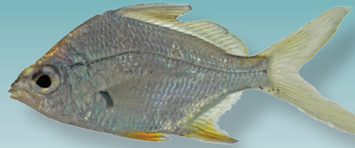
Diapterus auratus Ranzani, 1842 Mojarra guacha