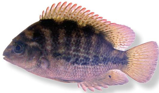
Vieja fenestrata (Günther 1860) Mojarra de La Lana