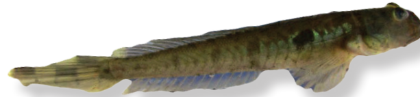
Gobionellus oceanicus (Pallas 1770) Madrejuile flecha