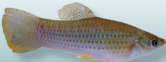
Poecilia mexicana Steindachner, 1863. topote del Atlántico