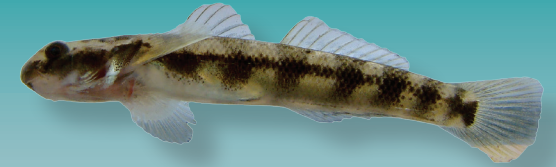
Awaous tajasica (Lichtenstein 1822) Gobio de río